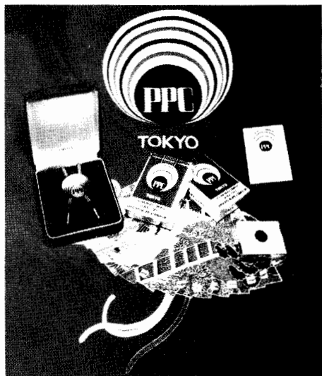
第10回汎太平洋不動産鑑定会議 東京大会における記念品