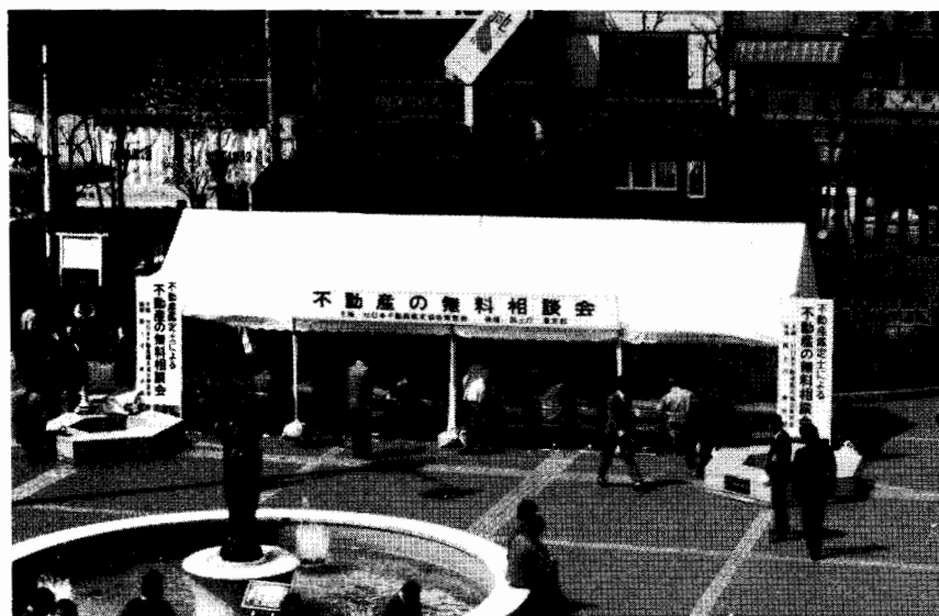
地価公示普及月間無料相談会 (S.60.4)