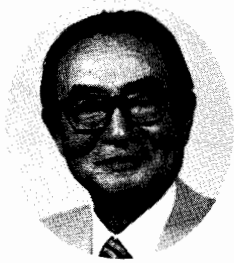
国 務 大 臣 河 本 嘉 久 蔵 国 土 庁 庁 官

社団法人日本不動産鑑定協会がこのたび創立20周年を迎えられましたことを心からお慶び申し上げます。