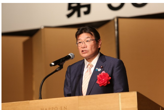
大塚国土交通副大臣による来賓挨拶