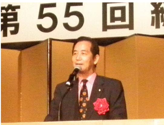
山本 幸三 衆議院議員