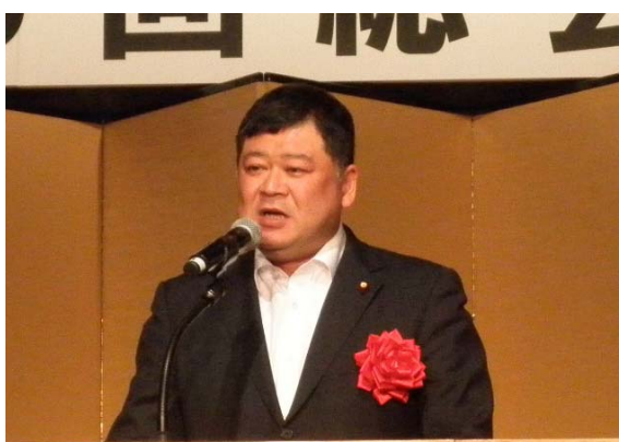
田中 英之 国土交通大臣政務官