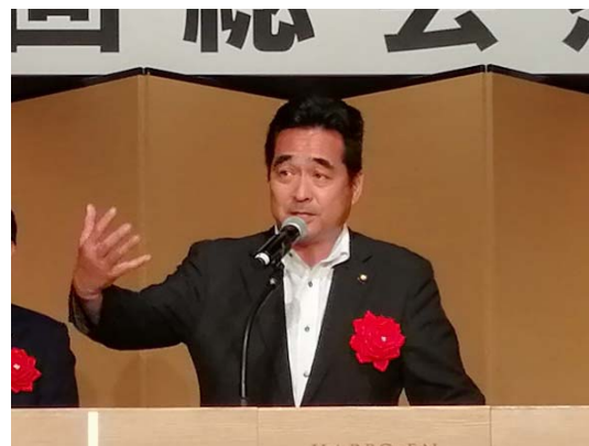
坂井 学 衆議院議員