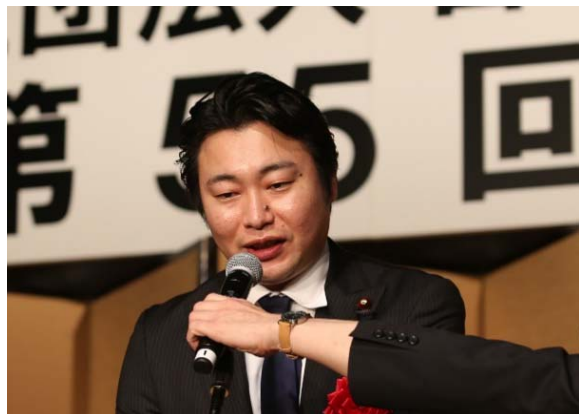
金子 俊平 衆議院議員