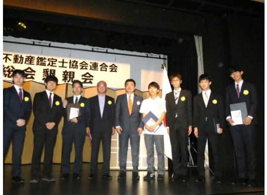
川柳コンテスト・PR 動画コンテスト表彰式