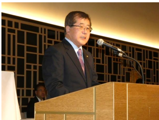
開会の挨拶を行う熊倉会長