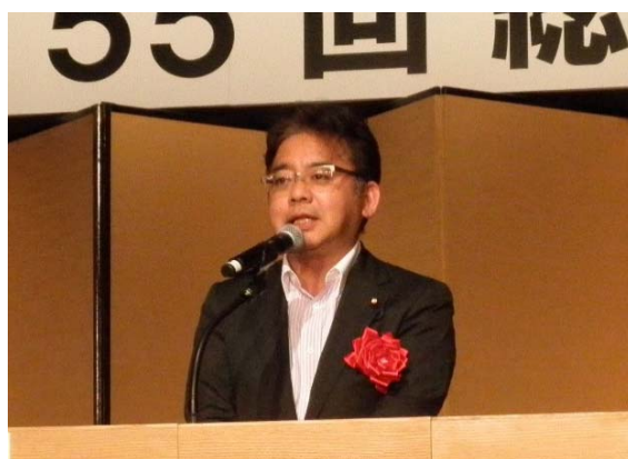
うへの 賢一郎 財務副大臣