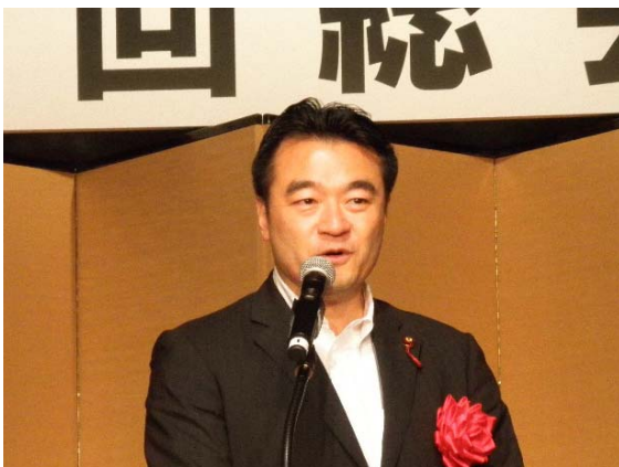
大岡 敏孝 衆議院議員