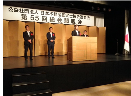
来場いただいた国会議員からのご挨拶

また、ご出席の国会議員からご挨拶をいただいたほか、本日の理事会で選定された副会長、業務執行理事のお披露目が行われ、なごやかな歓談のうち、盛会裡に懇親会を終えることができました。