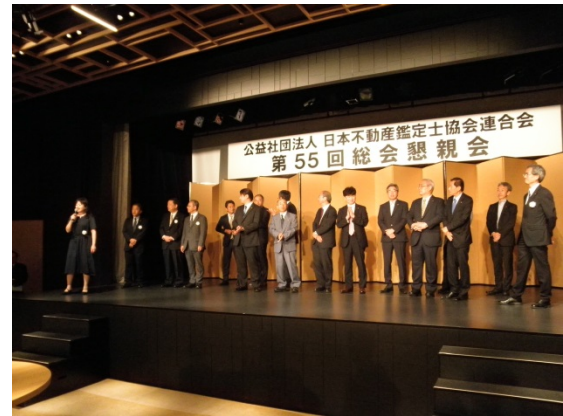
新役員（業務執行理事）披露