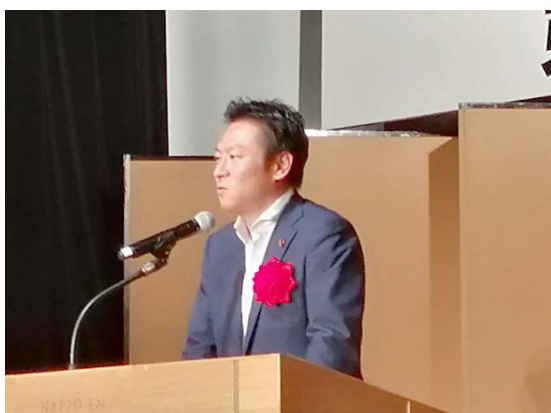
秋元 司 環境副大臣兼内閣府副大臣