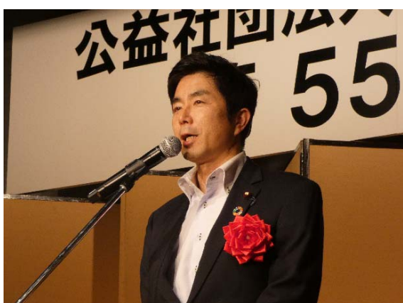
牧原 秀樹 衆議院議員