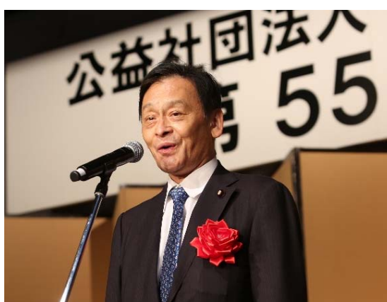
末原 信介 参議院議員