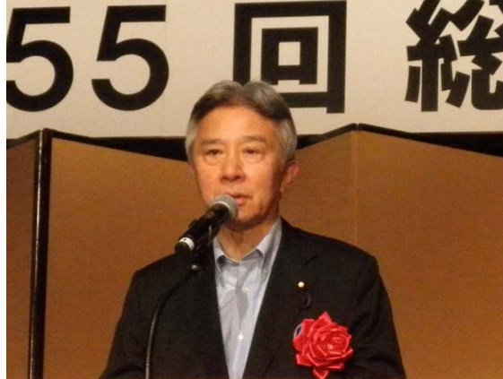
盛山 正仁 衆議院議員