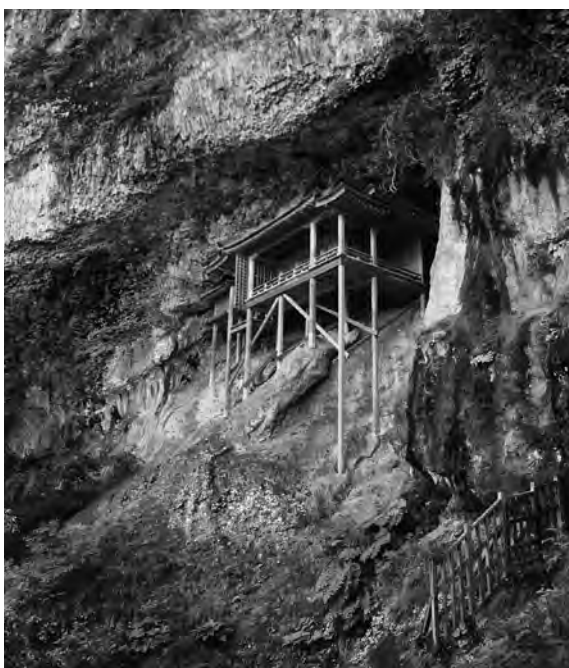
三徳山三佛寺投入堂

鳥取県の中部、温泉で有名な三朝（みささ）町に三徳山（みとくさん）という山があります。三徳山は標高約900mで、その中腹には三佛寺という寺院の奥院である投入堂があります。この投入堂は垂直に切り立った断崖絶壁にある岩窟に建てられており、魔法でも使わない限り建築は不可能と思われる場所にあります。普段は投入堂の中への立ち入りは禁止されており、下から見上げる形での参拝となりますが、修行の場でもあることからそこまで辿り着くのも険し