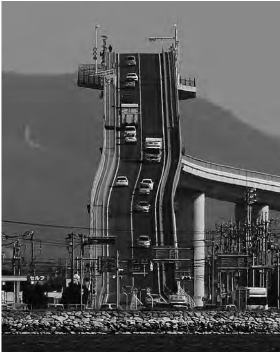
ベタ踏み坂 (江島大橋)

通りとなっていた駅前商店街を活性化しようと整備されたもので、境港駅前から約800mにわたり妖怪をモチーフにしたブロンズ像が153体設置してあり、妖怪ワールドを演出しています。観光客数は徐々に増えていき、今では年間200万人以上の人々が訪れる鳥取県を代表する観光地に成長しました。数年前から空き店舗がない状況が続いており、商店街活性化のモデルケースとなっています。