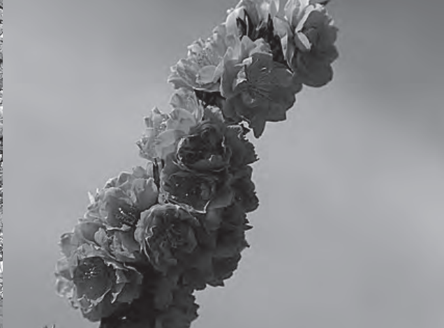
左上：きびだんご／右上：津山城／左下：備中国分寺／右下：もものはな