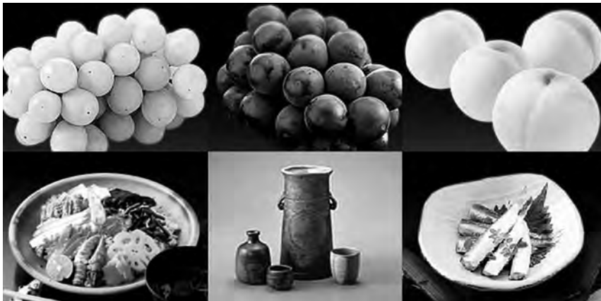
左上からマスカット・ピオーネ・白桃、備前ばら寿司、備前焼、ママカリの酢漬け

明治初期から西洋医学教育機関を持っていたことが幸いして、岡山県の医療水準は日本の中でも高く、現在、県内で高度な先進医療を実施している主な医療機関としては倉敷中央病院、岡山大学病院、川崎医科大学付属病院、心臓病センター榊原病院、岡山東部脳神経外科などがあり、しばしば医療機関ランキングに顔を出し、安心社会を支えています。また、県内には3つの国公立大学、15の私立大学が設置され、人口10万人当たりの大学・短大設置数は全国第6位です。ちなみにランキング上位のものを挙げますと、都道府県立図書館個人貸出数・全国第1位/美術館数・第5位/人口当たり医師数・第7位/震度4以上地震観測回数・第3位/2人以上の世帯家計年間収入額・第9位/有効求人倍率/第5位となっています。