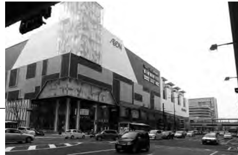
イオンモール岡山