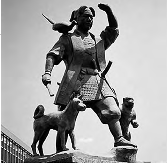
左：岡山駅前の桃太郎像 右：岡山県の位置図