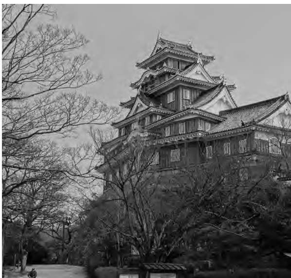
上…姫路の白鷺城に対し鳥城と呼ばれる岡山城／右…日本三名園の後樂園

現在の岡山県域には、旧石器時代から人々が居住していたことが窺えます。縄文時代前期には畑作によるイネの栽培、縄文時代の終わり頃には、狩猟・採集活動をしながら水稲耕作も行われていました。古代には吉備国といわれ、畿内や北九州、出雲等とともに、日本列島の中心地の一つとして栄えていた地域でした。吉備国は、4世紀半ばに畿内勢力と同盟関係を築き、日本の統一に影響を与えました。優れた鉄製技術（備前長船の名刀技術として伝承）を持ち、その支配地域は現在の広島県中東部～兵庫県播磨地方～四国にも至っていたようで、これを指し示す大規模古墳が各地に残されており、巨大な権力が存在していたと考えられており、卑弥