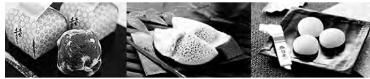
美味しい大手饅頭・倉敷むらすゞめ・吉備団子

観光地としては、岡山カルチャーゾーン(江戸時代を代表する回遊式の庭園の岡山後楽園・黒い外観から別名烏城の岡山城など)／倉敷(白壁の町並みの倉敷美観地区・エル・グレコ、ルノワールなど世界的な巨匠の作品を展示する大