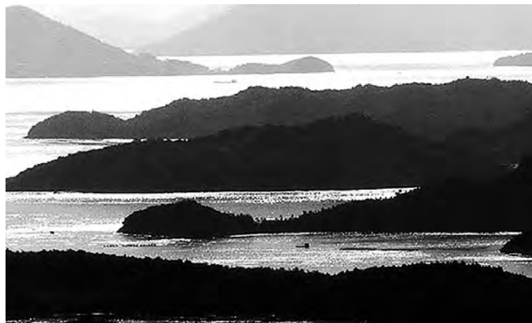
瀬戸内海の多島美

いる。台風や風雨が中国山地・四国山地によって弱められることが多く、県庁所在の岡山市は、吉備高原に属する北部を除いて、日照時間が年間約2,000時間と長く、年間降水量は1,100mm程度で降水量1mm未満の日数が全国最多であることから、「晴れの国岡山」と称する所以となっています。