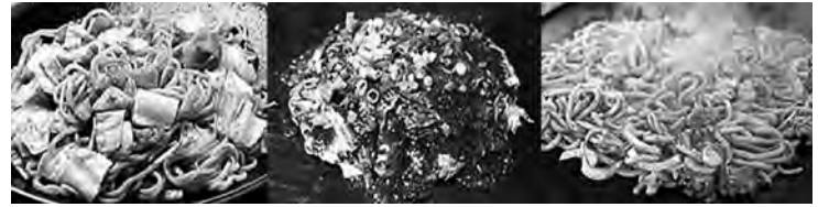
B級グルメ(蒜山焼きそば・日生牡蠣おこ・津山ホルモンうどん)

中国山地に源を発する3つの河川(吉井川、旭川、高梁川)は、良質で豊かな水を常にたたえており、古来より米の栽培が盛んで、今日でも良質米が生産されています。温暖な気候を生かして全国有数の質の高い農業が営まれ、全国一を誇るマスカット、ピオーネ(最近ではシャイン、瀬戸ジャイアンツも好評)を代表とするブドウ、白桃などを生産し、果物王国として有名で、鯖・ママカリ・カキなど水産物も多様で美味。和牛・ジャージー牛乳、作州黒大豆等々豊富な食材で、岡山ばら寿司/ままかり寿司/サワラ料理/鯖ずし/蒜山おこわ等の郷土料理があり、日生カキオコ/津山ホルモンうどん/ひ