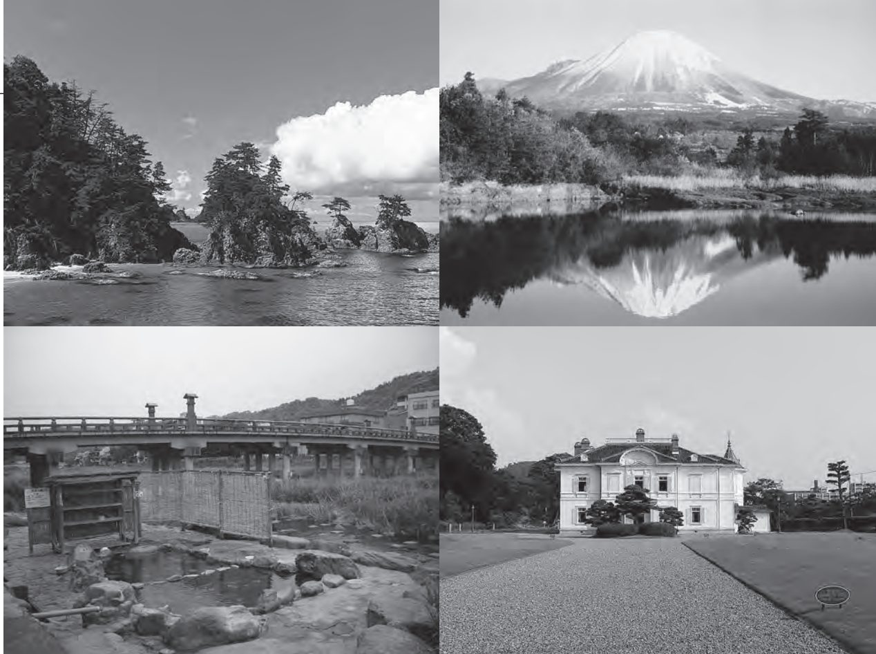
左上：浦富海岸／右上：大山／左下：三朝温泉／右下：仁風閣