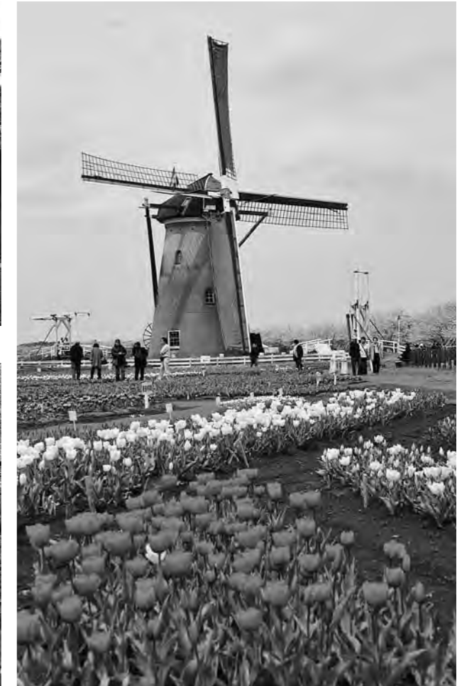
佐倉ふるさと広場