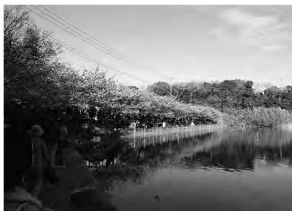
小松ヶ池公園の河津桜