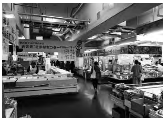
「うらり」三崎港産直センター