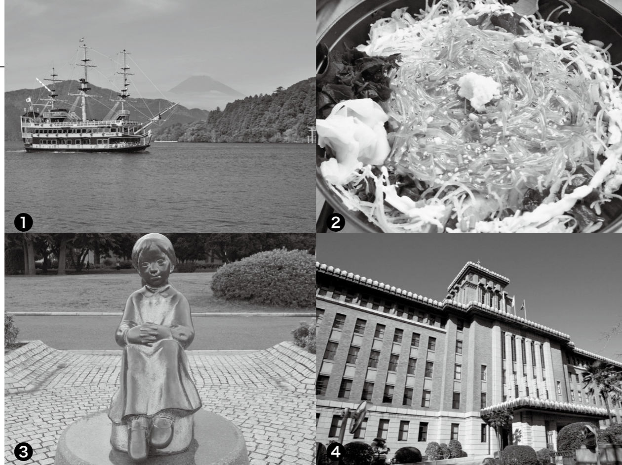
①芦ノ湖 ②生シラス丼 ③赤い靴はいていた女の子の像 ④神奈川県庁