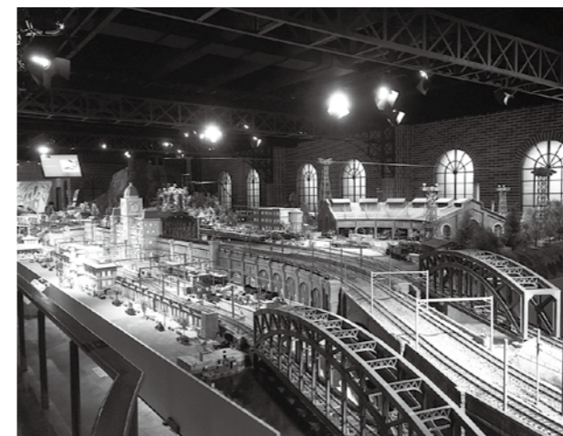
原鉄道模型博物館