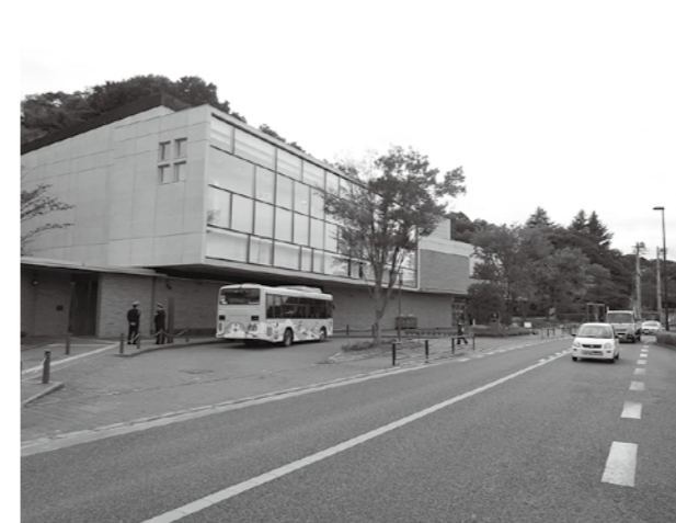
藤子F不二雄ミュージアム