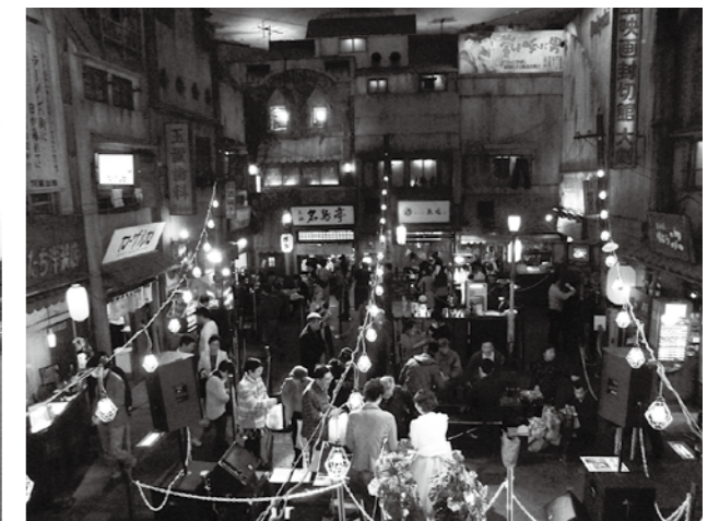
新横浜ラーメン博物館