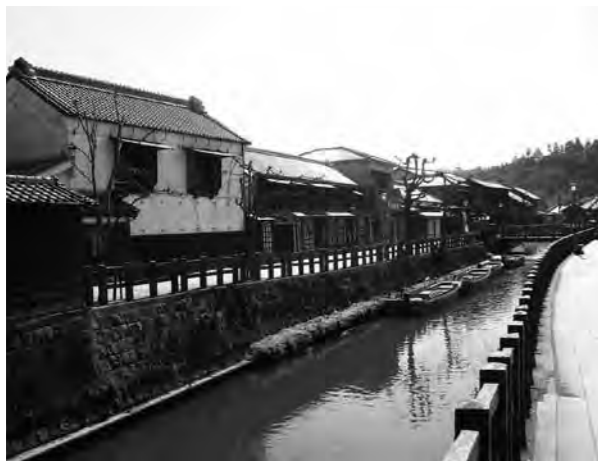
小野川沿いの旧商家の家並み

ります。市内を流れる小野川沿いには商家や土蔵が軒を連ね、利根川流域で随一といわれる河港商業都市の繁栄の面影を伝えています。