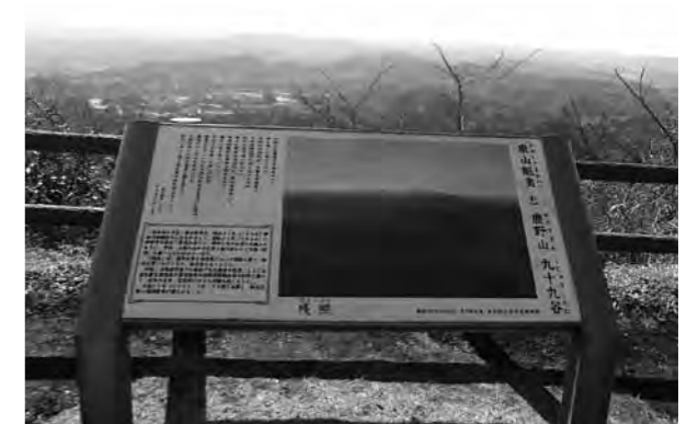
九十九谷眺望と説明板

形文化財に指定となり、修理復元後「青木繁《海の幸》記念館」として公開されています。