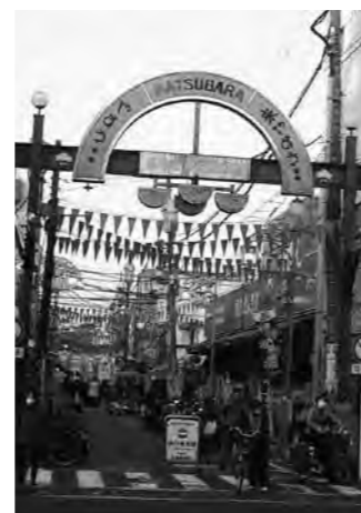
洪福寺松原商店街

休日には2万5,000人、平日でも2万人の人出で賑わう通称「ハマのアメ横」は、狭いエリアに個性的な安売り店がひしめく昭和の雰囲気満載の商店街です。ダンボールを屋根の上に投げつける青果店やマグロの解体もあるお馴染みの鮮魚店のほか、露店の飲食店や雑貨店等が建ち並び、見ているだけでもわくわくする場所です。未来の商店街像のモデルとして、横浜国大とのコラボによる商業活性化の取り組みも行われています。(馬場 佳子)