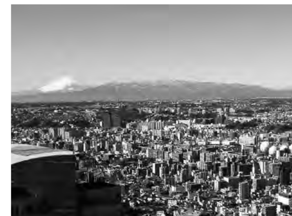
横浜都心から遠望した丹沢大山国定公園

丹沢山地のシンボリック的存在である大山は、丹沢山塊の東端に突出した1,252mの独立峰で、江戸時代より大山講で親しまれた信仰の山です。