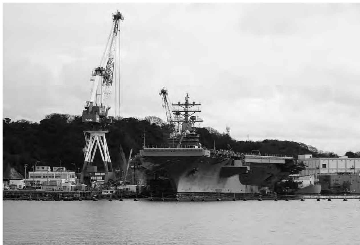
軍港めぐりより空母ロナルド・レーガン