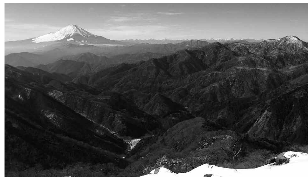
塔ノ岳から望む富士山・西丹沢

また、雨乞いの山として名高く、大山阿夫利神社、大山寺などの由緒ある寺院仏閣を擁し、江戸の昔から多くの参拝客で賑わってきました。登山道は、大山ケーブル駅から男坂又は女坂を登り阿夫利神社下社を経由して山頂に至る表参道が親しまれています。ミシュラン・グリーンガイド・ジャポン改訂版に、大山が二つ星の評価で初めて掲載されました。大山阿夫利神社からの眺望が評価され、訪問者数は年間110万人を突破するようになり、今後の繁盛が期待されています。(鈴木 憲一)