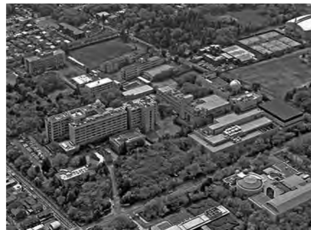
JAXA 相模原キャンパス全貌(HPより)