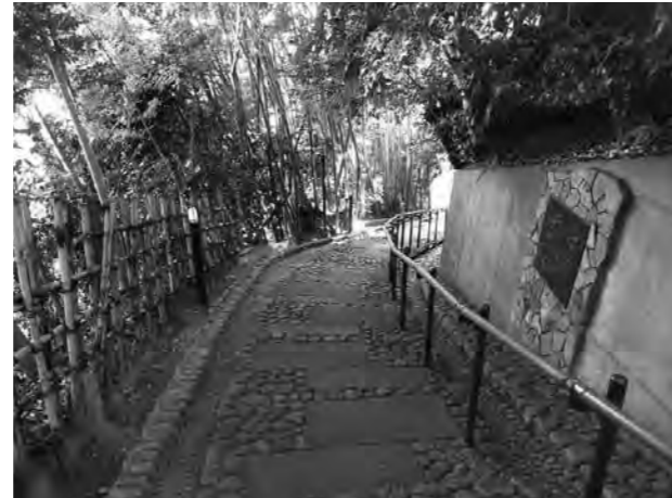
旧柳宗悦邸へと続く天神坂