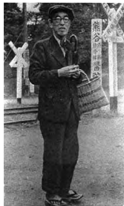
在りし日の永井荷風 背広にチヨウネクタイ、下駄ばきにコウモリガサ、買い物カゴの荷風スタイル（昭和22年10月）