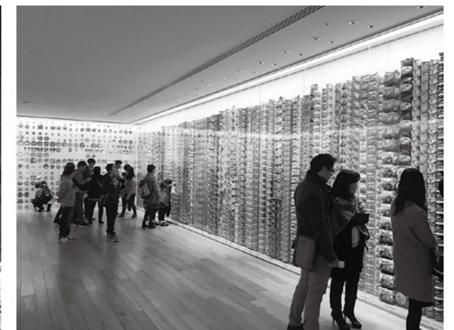
カップヌードルミュージアム