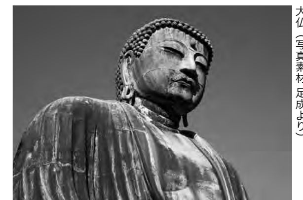
大仏(写真素材 足成より)