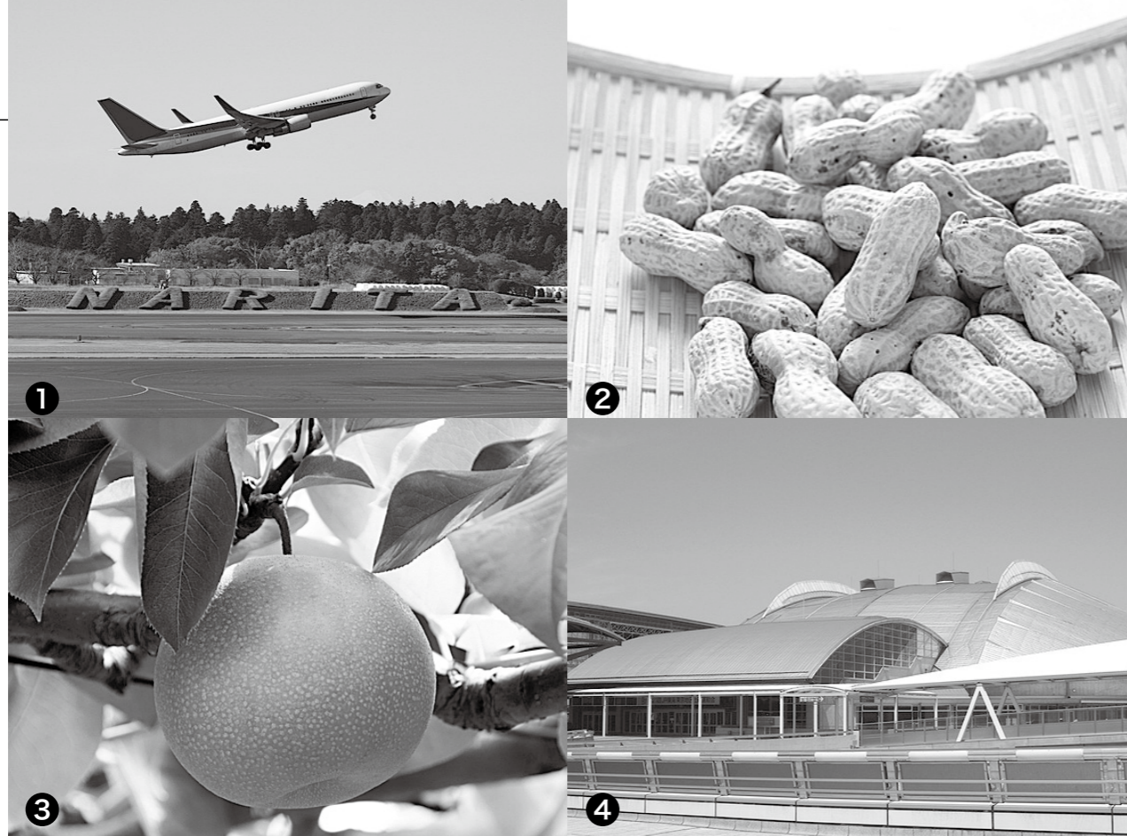
①成田空港 ②落花生 ③梨 ④幕張メッセ