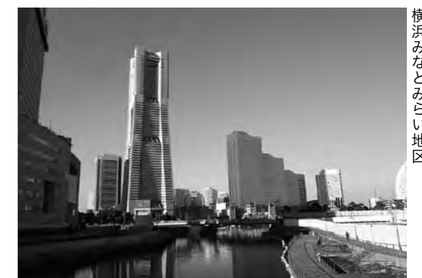
横浜みなとみらい地区

工業地価は県平均で上昇しています。特に、圏央道さがみ縦貫道路の開通による利便性向上と物流施設用地の旺盛な需要により、厚木市、相模原市、寒川町など県央部において上昇幅の拡大がみられます。(諸田 浩之)