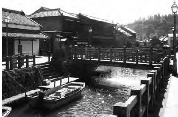
伊能忠敬旧宅付近