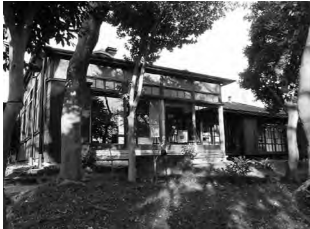
旧杉村楚人冠邸（杉村楚人冠記念館）