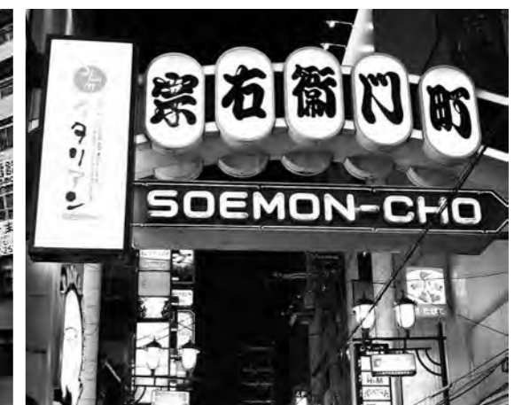
左/ドンキホーテ道頓堀店の観覧車 ©(公財)大阪観光局 上/宗右衛門町 ©(公財)大阪観光局

オペラやコンサートの他、各界著名人の講演会も数多く開催されるなど、大阪の文化・芸術の発展に深く関わっている、現役の公会堂建築物である。ネオルネッサンス様式の美しい外観は、中之島を訪れる多くの人に愛され親しまれている。中央公会堂は、大阪府不動産鑑定士協会主催の「土地月間記念講演会」で度々利用させて頂いており、大変お世話になっている建築物である。