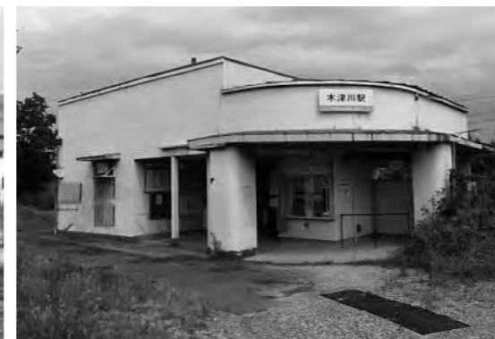
上/南海汐見橋線・木津川駅 左/木津川渡船場