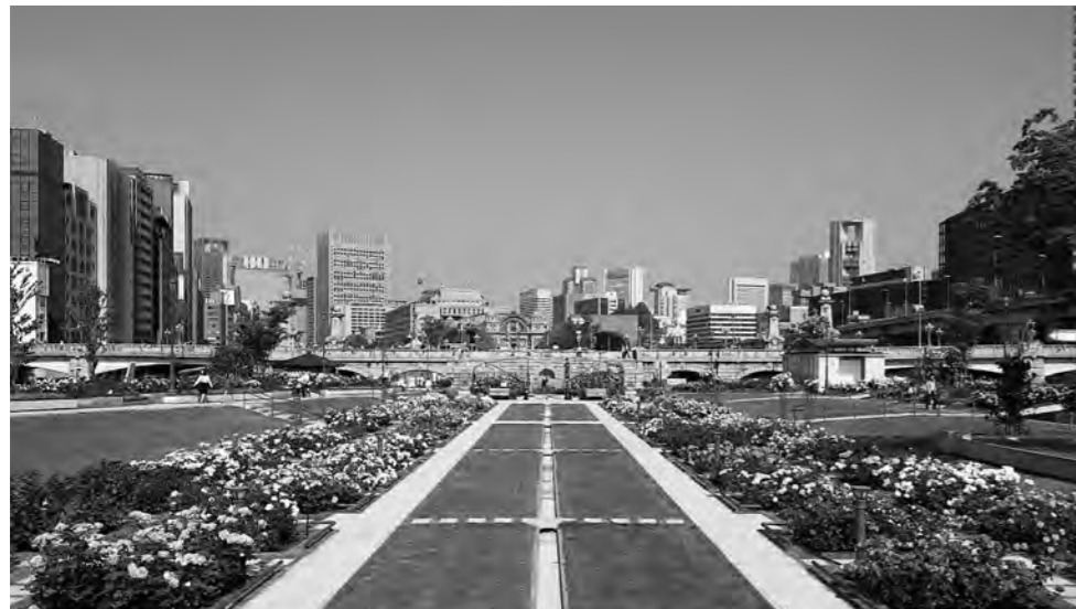
左/中之島公園