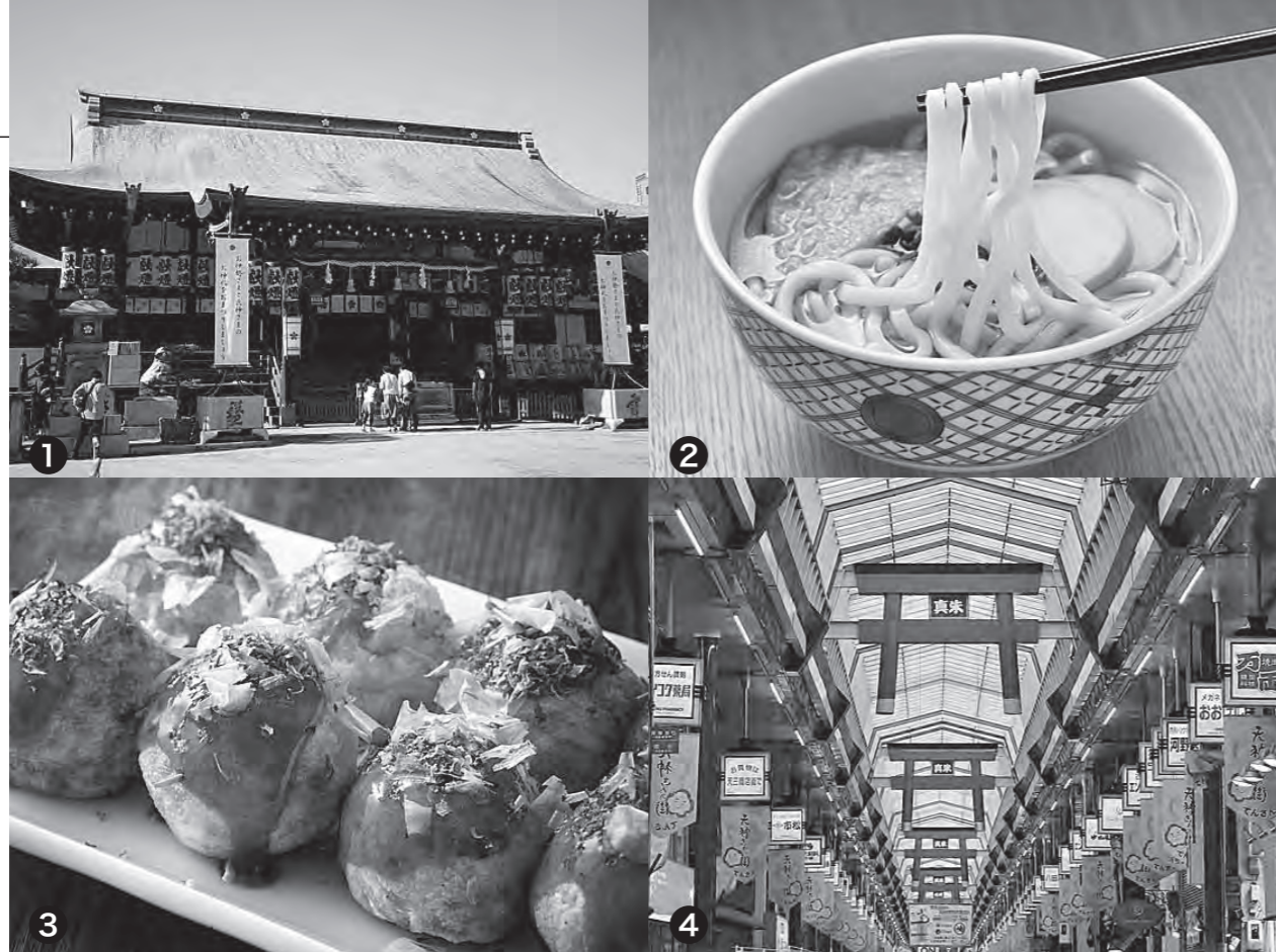
①大阪天満宮 ②うどん ③たこ焼き ④天神橋筋商店街