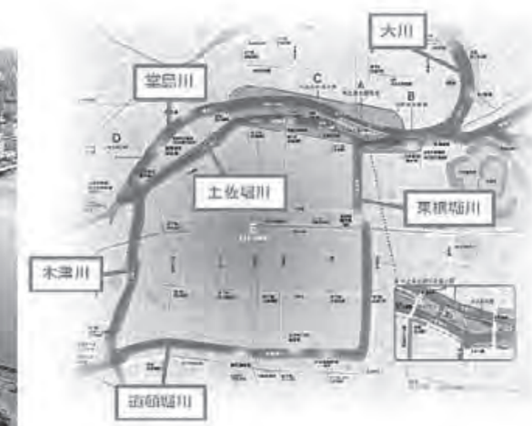
水の回廊 (水と光のまちづくり支援本部)

之島公園と調和し、堤防上の遊歩道などによる美しい緑が都市景観と融合し、そこに人々が集まり、語らい、笑い、癒しを提供してくれる憩いの水辺となっている。また、周辺には、明治から昭和の初期にかけて建築された洋式建築物や古い橋も数多く点在しており、歴史と文化に満ち溢れた景観となっている。