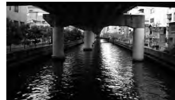
下/東横堀川

のみである。木津川駅は大阪市西成区北津守に立地する駅であり、1900年（明治33年）に水陸運輸の連絡の要地として開業した（現在は無人駅である）。木津川駅は、他鉄道を含む大阪の駅全体で最も利用者の少ない駅と言われており、さらに駅舎の場所が分かりにくいため、「大都会の中の秘境駅」と呼ばれる事もある。また、そのレトロでこじんまりとした外観には、隠れファンも多いと聞く。大阪にお立ち寄りの際は一度訪れて下さい。