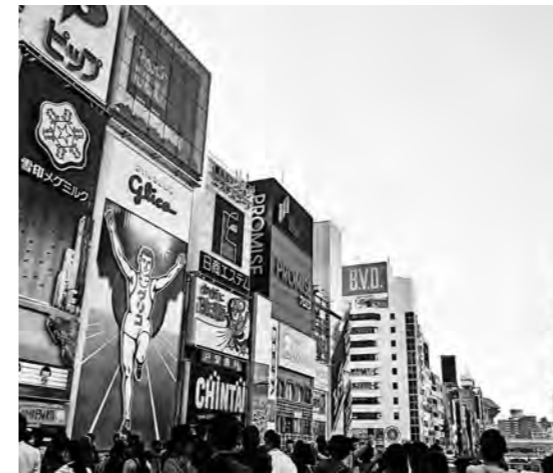
上/グリコの看板 ©(公財)大阪観光局 右/とんぼりリバーウォーク ©(公財)大阪観光局