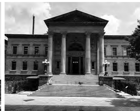
上/大阪府立中之島図書館(柳 貴之) 左/大阪市中央公会堂 ©(公財)大阪観光局