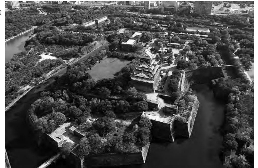
右/大阪城公園